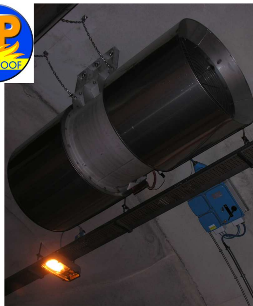
IMPIANTI DI VENTILAZIONE