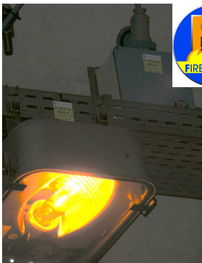
IMPIANTI DI ILLUMINAZIONE