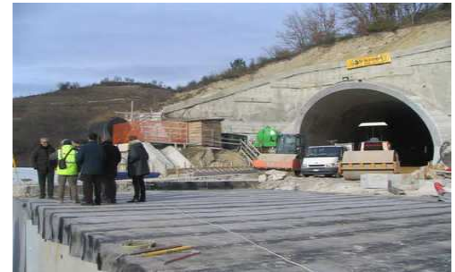
Lavori al traforo di Croce di Casale

L'opera, realizzata dall'Anas, è formata da una piattaforma stradale con due corsie di 3,50 metri, una per ogni senso di marcia, e da due banchine da 1,25metri. Per la sua particolare collocazione geografica, l'arteria costituisce una delle più importanti infrastrutture della viabilità del Piceno in grado di soddisfare le crescenti esigenze di mobilità del territorio. Collegando infatti la Valle del Tronto con la Valdaso, si pone al servizio degli importanti insediamenti industriali e artigianali presenti nel comprensorio e contribuirà pertanto alla rivitalizzazione e sviluppo socio-economico dell'area.